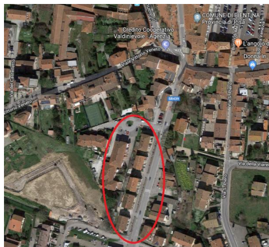
Figura 1: Localizzazione area dell' intervento

Si riportano le fotografie dell' ubicazione dei fabbricati e dello stato di consistenza del complesso residenziale: