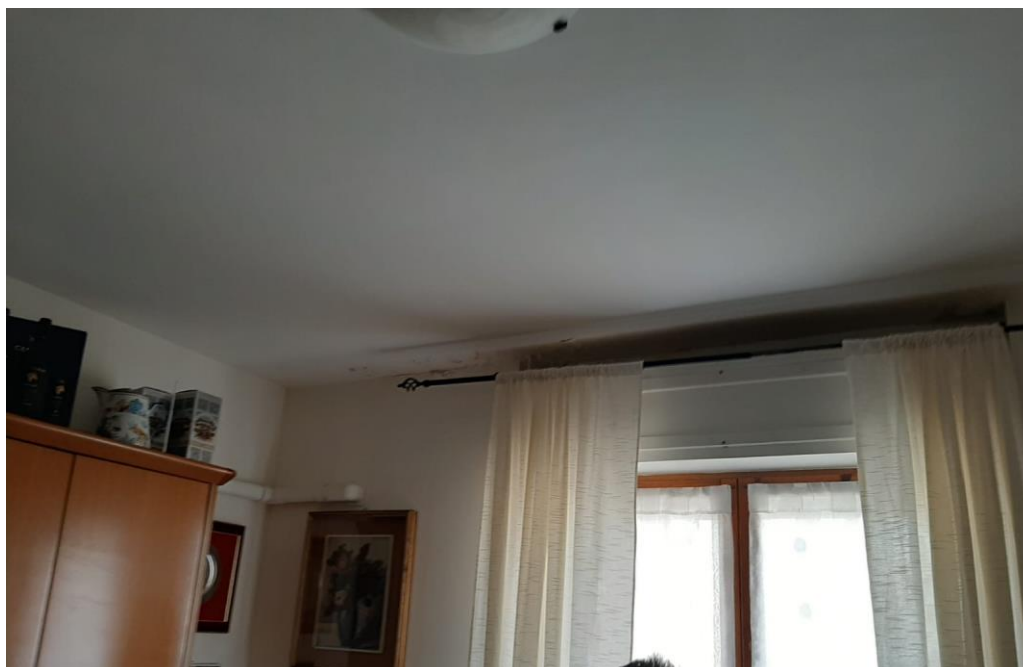
FOTO N. 2 infiltrazioni acque meteoriche in locali dell'alloggio direttamente a tetto

e-mail: apespisa@apespisa.it - Tel. 050/505711 - FAX 050/45040 Orari U.R.P. nei giorni di LUNEDI', MERCOLEDI', VENERDI' dalle ore 10 alle ore 12,30. MARTEDI' dalle ore 15,30 alle 17,00.