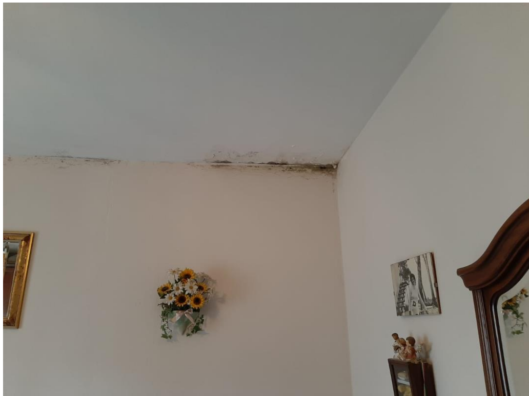
FOTO N. 1 infiltrazioni acque meteoriche in locali dell'alloggio direttamente a tetto