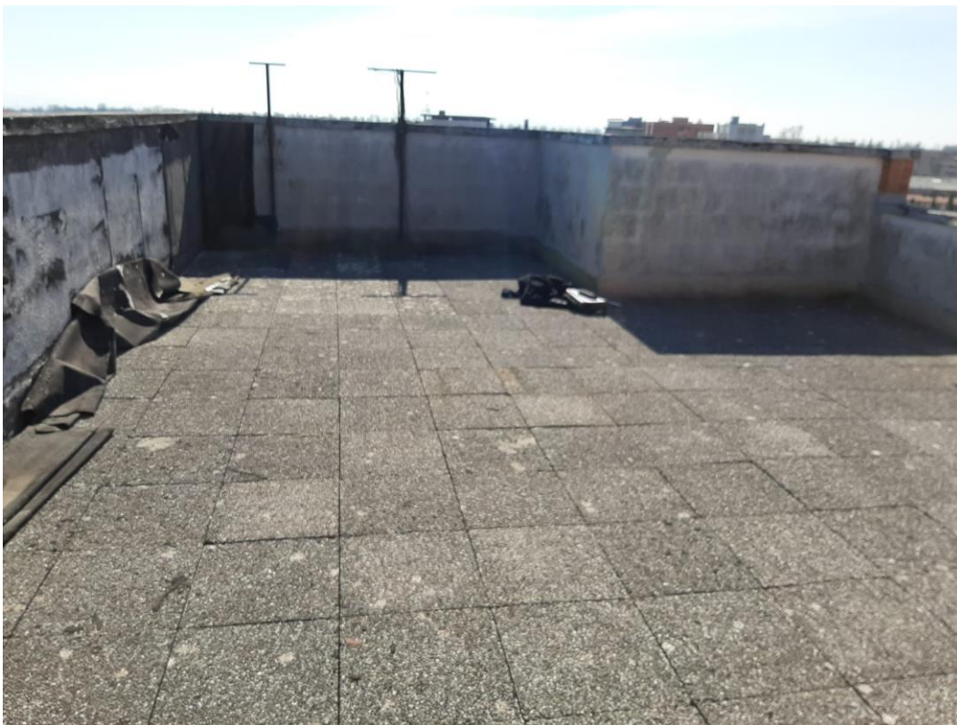
FOTO N. 5 foto panoramica della copertura e dei parapetti

e-mail: apespisa@apespisa.it - Tel. 050/505711 - FAX 050/45040 Orari U.R.P. nei giorni di LUNEDI', MERCOLEDI', VENERDI' dalle ore 10 alle ore 12,30. MARTEDI' dalle ore 15,30 alle 17,00.