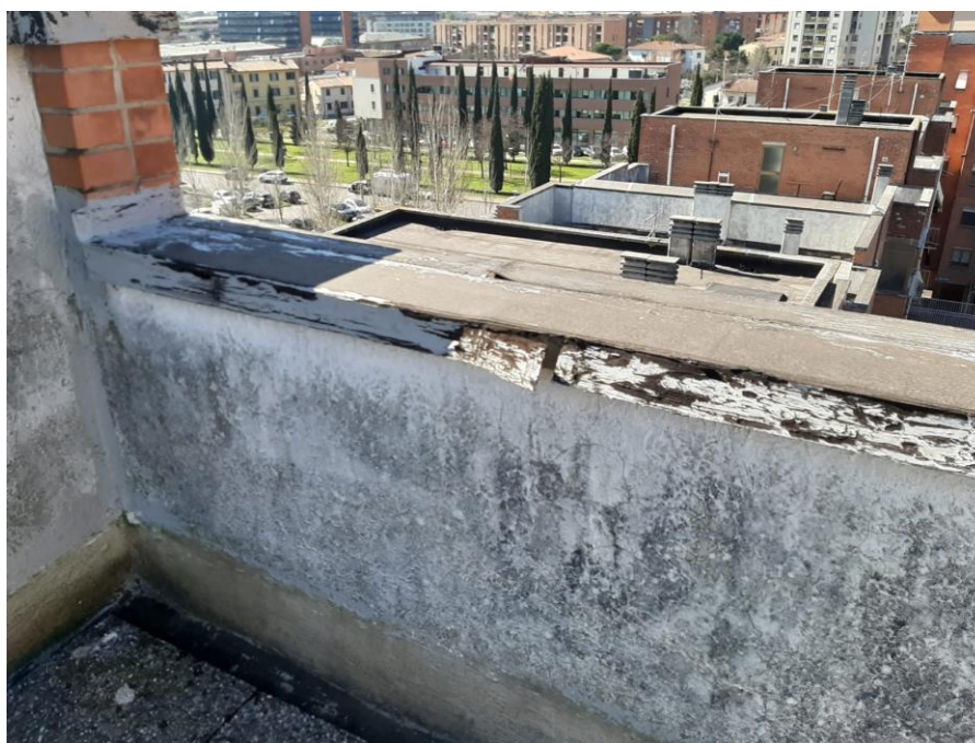
FOTO N.9 foto parapetti da trattare

e-mail: apespisa@apespisa.it - Tel. 050/505711 - FAX 050/45040 Orari U.R.P. nei giorni di LUNEDI', MERCOLEDI', VENERDI' dalle ore 10 alle ore 12,30. MARTEDI' dalle ore 15,30 alle 17,00.