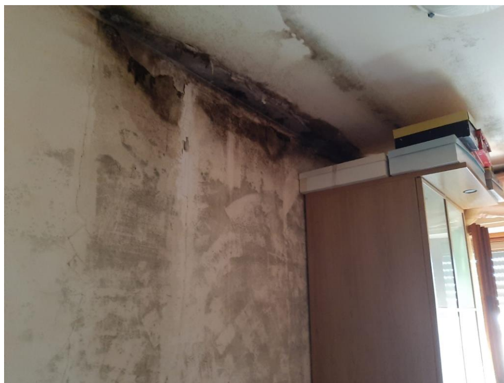
FOTO N. 3 infiltrazioni acque meteoriche in locali dell'alloggio direttamente a tetto

e-mail: apespisa@apespisa.it - Tel. 050/505711 - FAX 050/45040 Orari U.R.P. nei giorni di LUNEDI', MERCOLEDI', VENERDI' dalle ore 10 alle ore 12,30. MARTEDI' dalle ore 15,30 alle 17,00.