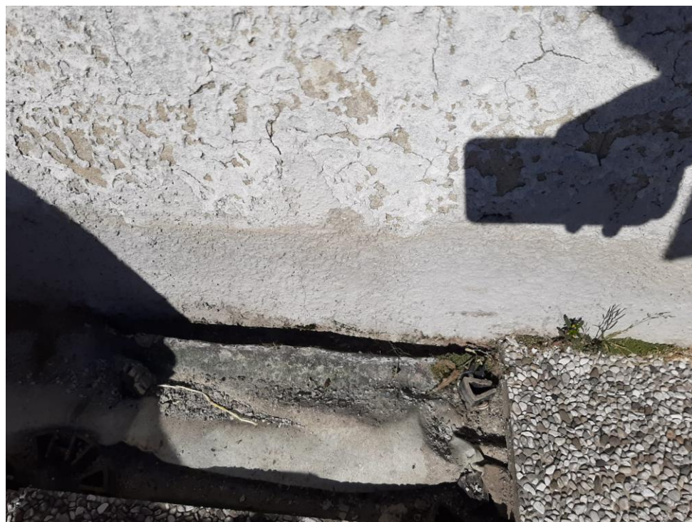
FOTO N. 4 foto tnt da rimuovere delle copertura piana

e-mail: apespisa@apespisa.it - Tel. 050/505711 - FAX 050/45040 Orari U.R.P. nei giorni di LUNEDI', MERCOLEDI', VENERDI' dalle ore 10 alle ore 12,30. MARTEDI' dalle ore 15,30 alle 17,00.