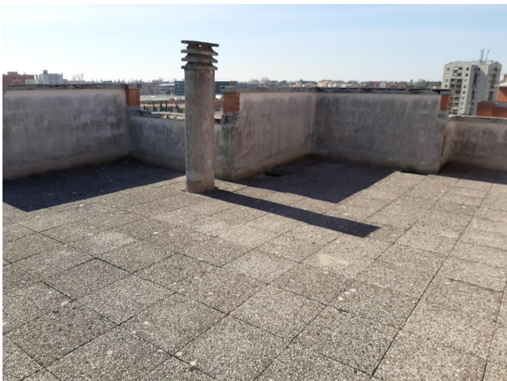
FOTO N. 6 foto panoramica della copertura e dei parapetti

AZIENDA PISANA EDILIZIA SOCIALE s.c.p.a Capitale sociale € 870.000,00 interamente versato Iscrizione C.C.I.A.A. di Pisa REA n. 147832