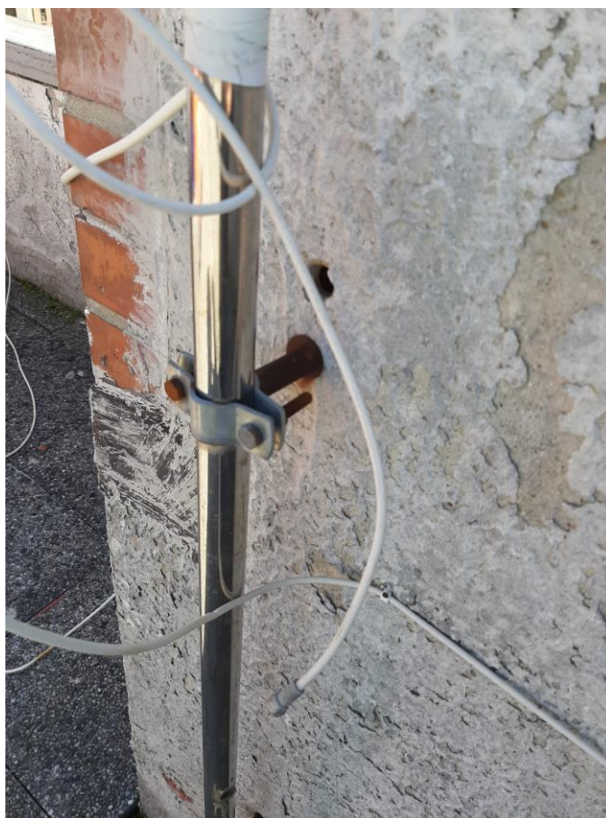
FOTO N. 6 foto parapetti da trattare

e-mail: apespisa@apespisa.it - Tel. 050/505711 - FAX 050/45040 Orari U.R.P. nei giorni di LUNEDI', MERCOLEDI', VENERDI' dalle ore 10 alle ore 12,30. MARTEDI' dalle ore 15,30 alle 17,00.