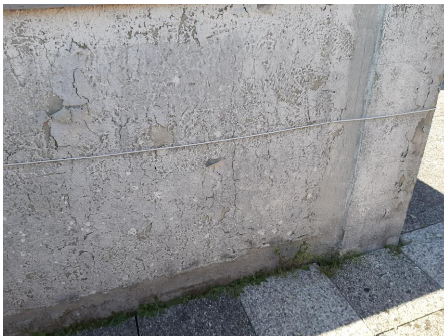
FOTO N. 5 foto parapetti da trattare

AZIENDA PISANA EDILIZIA SOCIALE s.c.p.a Capitale sociale € 870.000,00 interamente versato Iscrizione C.C.I.A.A. di Pisa REA n. 147832