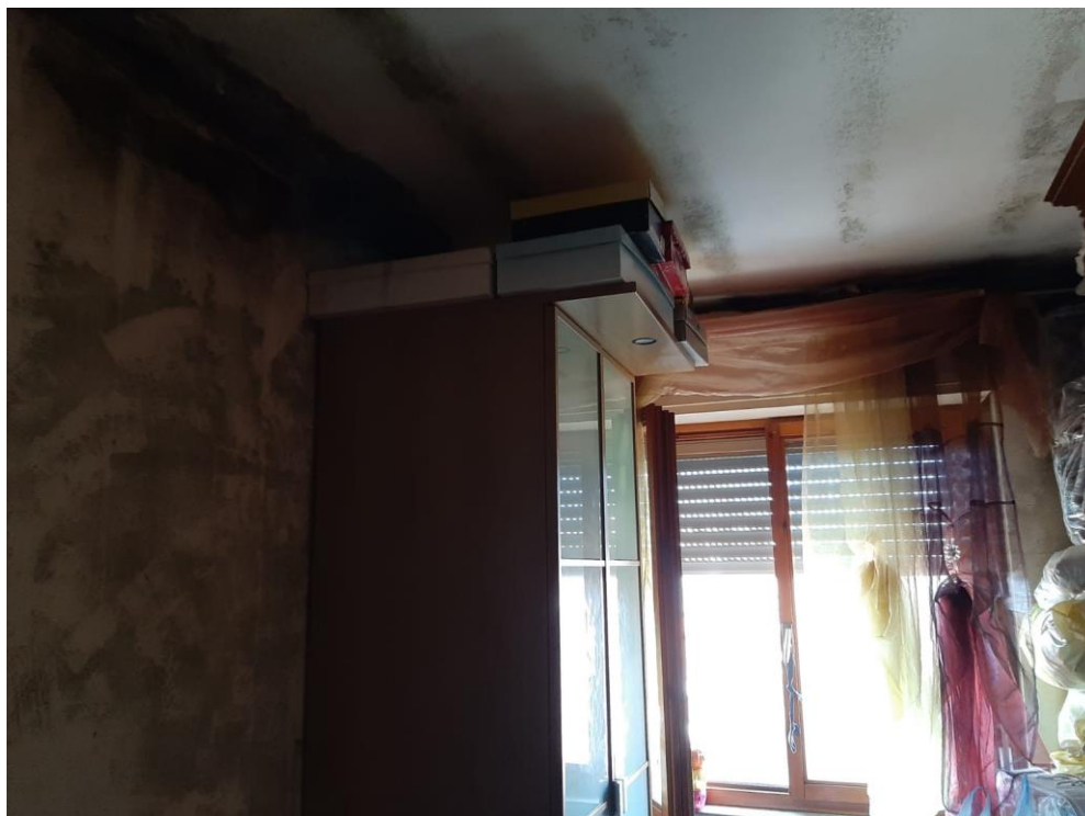
FOTO N. 2 infiltrazioni acque meteoriche in locali dell'alloggio direttamente a tetto

AZIENDA PISANA EDILIZIA SOCIALE s.c.p.a Capitale sociale € 870.000,00 interamente versato Iscrizione C.C.I.A.A. di Pisa REA n. 147832