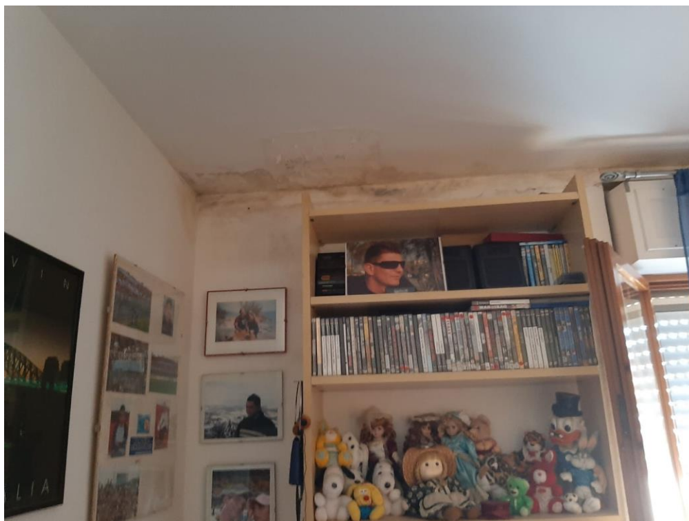
FOTO N. 3 infiltrazioni acque meteoriche in locali dell'alloggio direttamente a tetto

AZIENDA PISANA EDILIZIA SOCIALE s.c.p.a Capitale sociale € 870.000,00 interamente versato Iscrizione C.C.I.A.A. di Pisa REA n. 147832