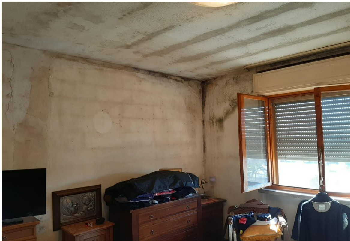
FOTO N. 1 infiltrazioni acque meteoriche in locali dell'alloggio direttamente a tetto

e-mail: apespisa@apespisa.it - Tel. 050/505711 - FAX 050/45040 Orari U.R.P. nei giorni di LUNEDI', MERCOLEDI', VENERDI' dalle ore 10 alle ore 12,30. MARTEDI' dalle ore 15,30 alle 17,00.