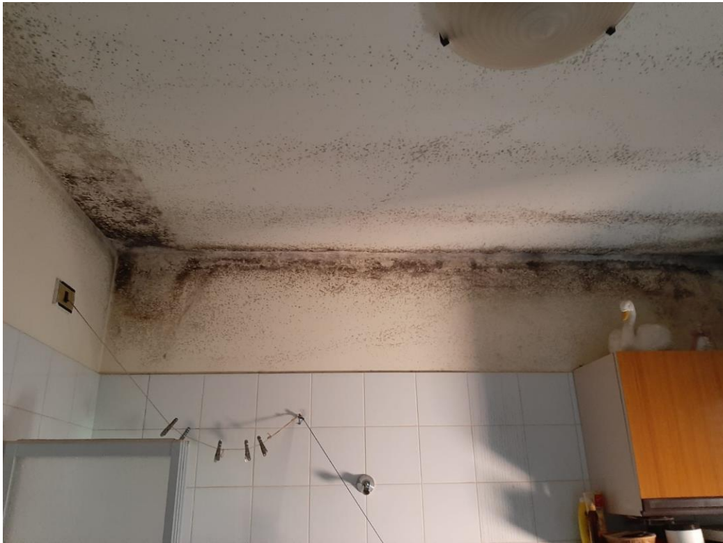
FOTO N. 4 infiltrazioni acque meteoriche in locali dell'alloggio direttamente a tetto

AZIENDA PISANA EDILIZIA SOCIALE s.c.p.a Capitale sociale € 870.000,00 interamente versato Iscrizione C.C.I.A.A. di Pisa REA n. 147832