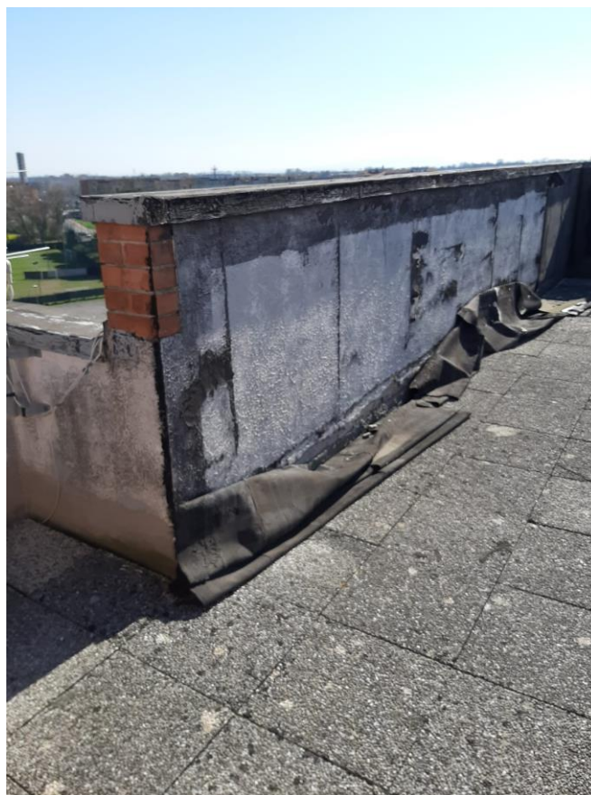
FOTO N. 8 foto parapetti da trattare

AZIENDA PISANA EDILIZIA SOCIALE s.c.p.a Capitale sociale € 870.000,00 interamente versato Iscrizione C.C.I.A.A. di Pisa REA n. 147832