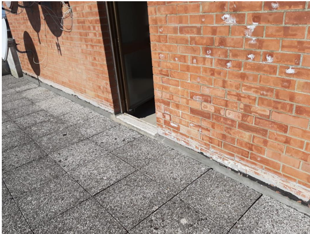
FOTO N. 7 foto della parete oggetto di futura installazione di scossalina

e-mail: apespisa@apespisa.it - Tel. 050/505711 - FAX 050/45040 Orari U.R.P. nei giorni di LUNEDI', MERCOLEDI', VENERDI' dalle ore 10 alle ore 12,30. MARTEDI' dalle ore 15,30 alle 17,00.